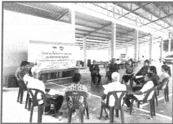
๓.๗ ภาพประกอบการดำเนินการโครงการ/กิจกรรม

๓.๖ เหตุผลที่เลือกเป็นโครงการ/กิจกรรมที่มีการขับเคลื่อน SDGs ที่ดีเด่น (Best – Practice) เนื่องจากจังหวัดได้เลือก การลดความยากจน (Poverty reduction) เป็นหนึ่งในวาระการพัฒนายั่งยืน (SDGs) ของจังหวัด ซึ่งเป็นนโยบายของรัฐบาลและกระทรวงมหาดไทย โดยจังหวัดได้ขับเคลื่อนการดำเนินการผ่านศูนย์อำนวยการจัดความยากจนและพัฒนาคนทุกช่วงวัยอย่างยั่งยืนตามหลักปรัชญาของเศรษฐกิจพอเพียงจังหวัด (ศจพ.จ.) เพื่อแก้ไขความยากจนในมิติด้านต่าง ๆ แก่ครัวเรือนที่ประสบปัญหาความเดือดร้อน โครงการนี้จึงเป็นโครงการที่ขยายผลการดำเนินการตามวาระการพัฒนายั่งยืนของจังหวัดในประเด็นการลดความยากจน เพื่อให้เกิดการขับเคลื่อนอย่างต่อเนื่อง และเกิดประโยชน์ต่อประชาชนในการลดความยากจนได้อย่างยั่งยืนต่อไป